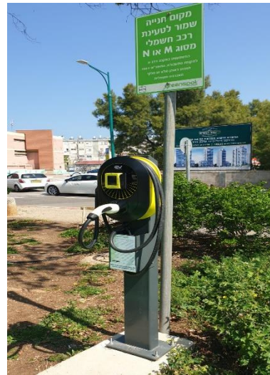
עמדת טעינה בקרית ים

בשנת 2020, שמה לה המחלקה המשפטית למטרה להמשיך ולקדם פתרונות משפטיים בנושא של טיפול בפסולת וקידום חקיקה ביחס לשריפות פיראטיות בשטחים הפתוחים. חיזוק סמכויות יחידת האכיפה הסביבתית ומיצוי יכולותיה לפי חוק.